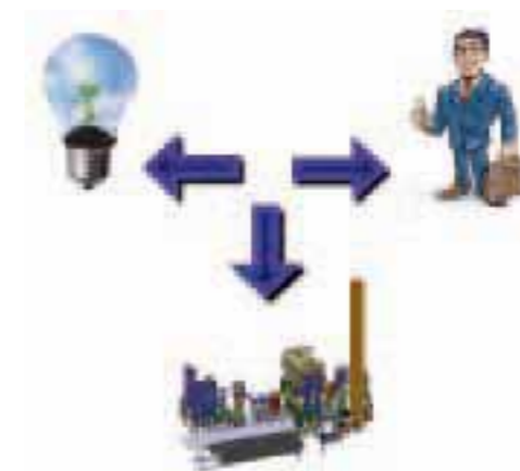
Figura 1.1 Le componenti elementari della strategia

L'idea imprenditoriale: alla base di ogni esperienza manageriale c'è sempre la propulsione di un'idea di potenziale successo che funge da stimolo costante all'investimento di energie e risorse. La fantasia dei creatori italiani è molto feconda e può generarsi da spunti molteplici, quali un percorso di studio, un episodio lavorativo, un'invenzione brevettata, un'opportunità di mercato non ancora sfruttata, relazioni interpersonali e tempo libero, ma è fondamentale che a fini pratici segua tre direttrici caratteristiche: