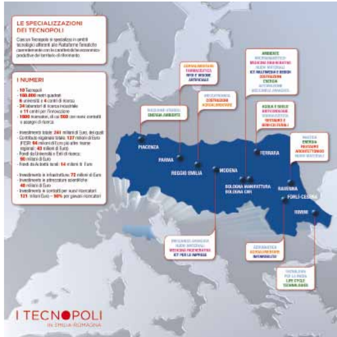
Figura 3.1 La mappa dei Tecnopoli emiliano-romagnoli